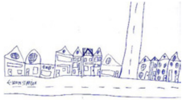
Tekening van een kind uit het 3de-4de leerjaar. Woont in een rijhuis aan een vrij drukke weg.