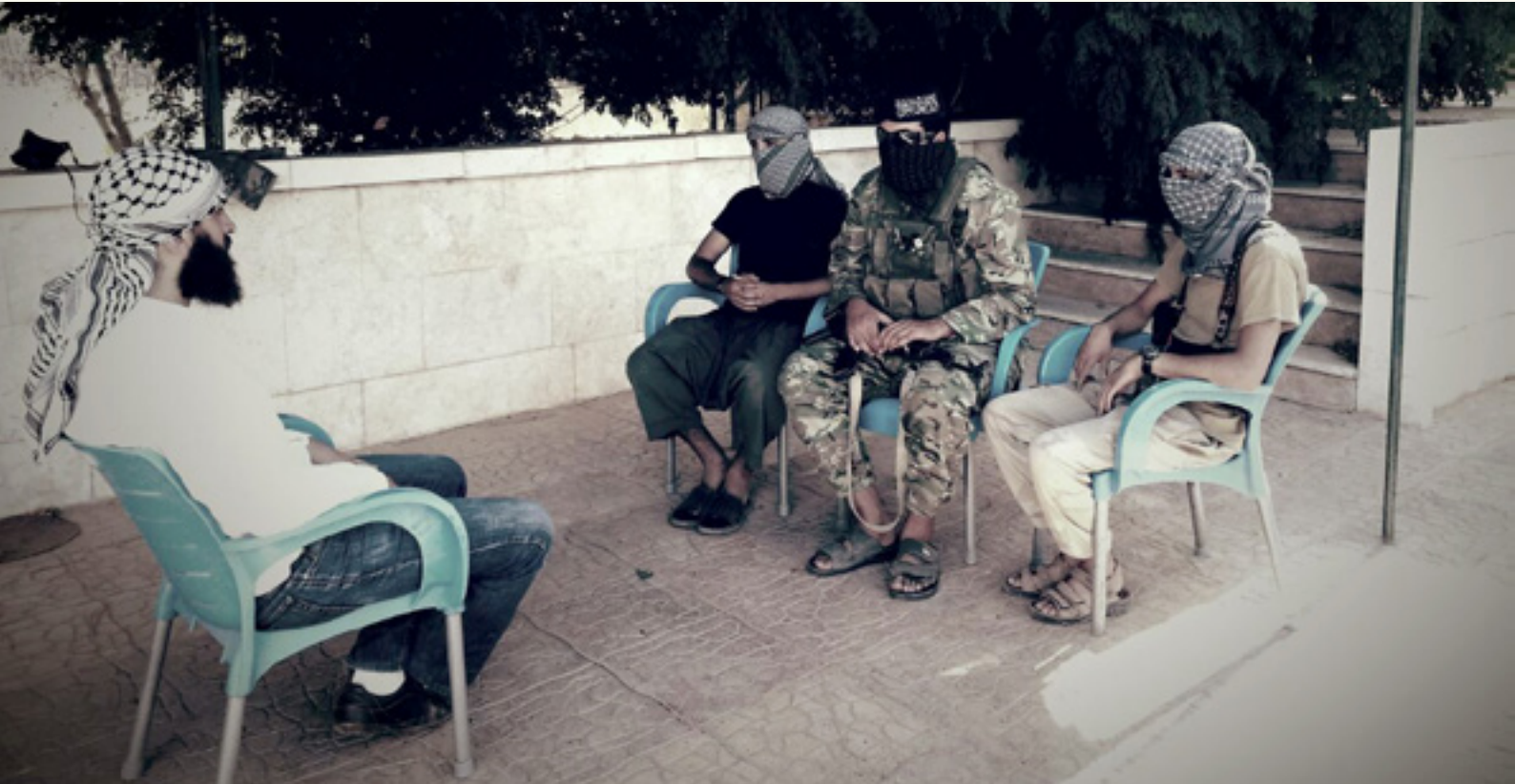
Foto: Montasser (links) in gesprek met enkele Belgische Syriëstrijders.

Die jongeren trekken zich ook op aan het feit dat ze in Syrië iets betekenen. Hun strijderschap, de Kalasjnikovs, het groepsgevoel, het gemeenschappelijke doel, dit alles geeft hen een identiteit. Dáár zijn die jongeren iets, terwijl ze bij ons veel meer moeite moeten doen om iets te bereiken.”