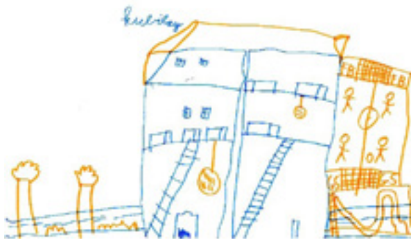
Tekening van een jongen uit het 3de leerjaar. Hij woont in een wijk met hoogbouwwooningen. Er is relatief veel open ruimte.