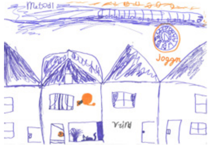
Tekening van een kind uit het 5de - 6de leerjaar. Woont in een drukke en dichtbebouwde buurt (hoewel dat niet noodzakelijk de sfeer van de tekening is).

hier beslist mee aan de slag. Maar er waren er die niet graag tekenden, anderen vonden het onderwerp niet leuk, en nog anderen hadden schrik dat hun tekening niet 'juist' of 'mooi' genoeg was. Het riep een heel denkspoor op over de mate waarin kinderen nog 'vrij' kunnen beslissen over hun deelname aan onderzoek in een schoolse context.