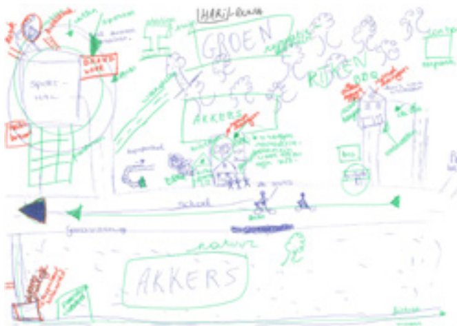
Mental map uit het 2de middelbaar. Jongeren wonen verder weg van de school, en we kunnen er dus niet van uitgaan dat dit een stedelijke buurt is.